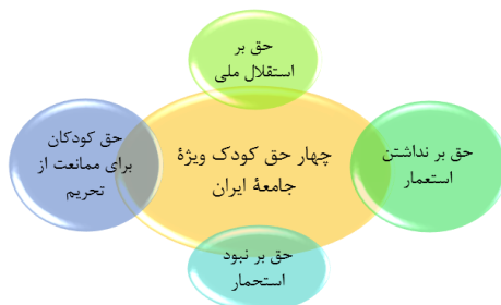
شکل ۳. چهار حق مطرح‌شده برای کودک، ویژه جامعه ایران

همان‌طور که مطرح شد چهار حق مذکور کودکان از سوی کنوانسیون دیده نشده است و این نشان می‌دهد، طراحان و تدوین‌کنندگان حقوق کودک در کنوانسیون، جوامعی بوده‌اند که با مسئله نقض استقلال ملی، استعمار، استحمار و تحریم روبه‌رو نبوده‌اند، یا تنها عامل آن بوده‌اند؛ به همین دلیل درکی از این مسائل در «نظام معنایی» و «حافظه جمعی» خود ندارند؛ بنابراین حقوق کودک در کنوانسیون را «جوامع مرکز» برای «جوامع پیرامون» تعریف کرده‌اند. این مسئله نشان می‌دهد، نه تنها جوامع پیرامون و «کودکان پیرامون» در تدوین حقوق کودک در نظر گرفته نشده‌اند، بلکه حقوق کودک جوامع مرکز و فضای «کودکان مرکز»، بر آن‌ها تحمیل شده است؛ بنابراین در چنین شرایطی تلاش برای تحقق حقوق «کودکان پیرامون» بر اساس اسناد بین‌المللی در بطن خود، حقوق کودکان را نقض می‌کند و این موضوع نیز در میثاق اسلامی حقوق کودک وجود دارد، اما مسئله مهم‌تر آگاهی‌نداشتن و اعتراض به چنین فضایی از سوی جوامع پیرامونی علیه جوامع مرکزی حقوق کودک است. در جوامع اسلامی نیز این آگاهی‌نداشتن و اقدام‌کردن نمایان است؛ به همین دلیل میثاق حقوق کودک در اسلام نه تنها این چهار حق ویژه برای کودکان جوامع عضو خود را نادیده انگاشته، بلکه مبنای و محورهای تعریف حقوق کودک را در بسیاری از موارد مبتنی بر کنوانسیون در نظر گرفته است، اما در ایران و سیاست‌های داخلی آن (سیاست‌های حکومتی) این چهار حق به صورت ضمنی مطرح شده‌اند، اما آگاهی و سیاست‌گذاری مستقیم و متمرکز برای آن‌ها وجود ندارد (شعبان، ۱۳۹۹).