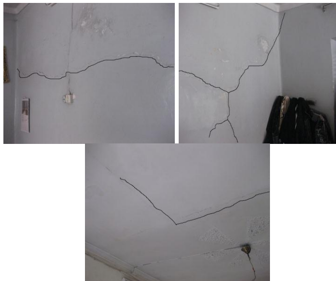
تصاویر ۲، ۳ و ۴. ترک خوردگی‌های دیوارها و سقف که با خطوط مشکی در تصاویر نشان داده شده است.