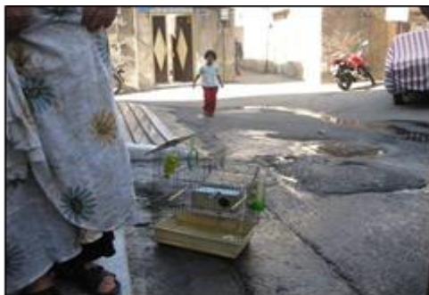
تصویر ۱. ورودی کوچه (آب‌های اضافی کوچه در چاه وسط کوچه جمع می‌شود)