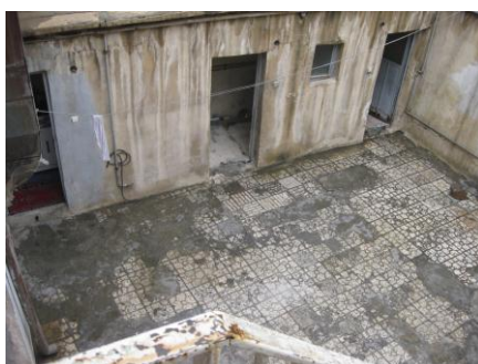
تصویر ۵. استفاده نکردن از حیاط برای مصارفی مانند شست‌وشو