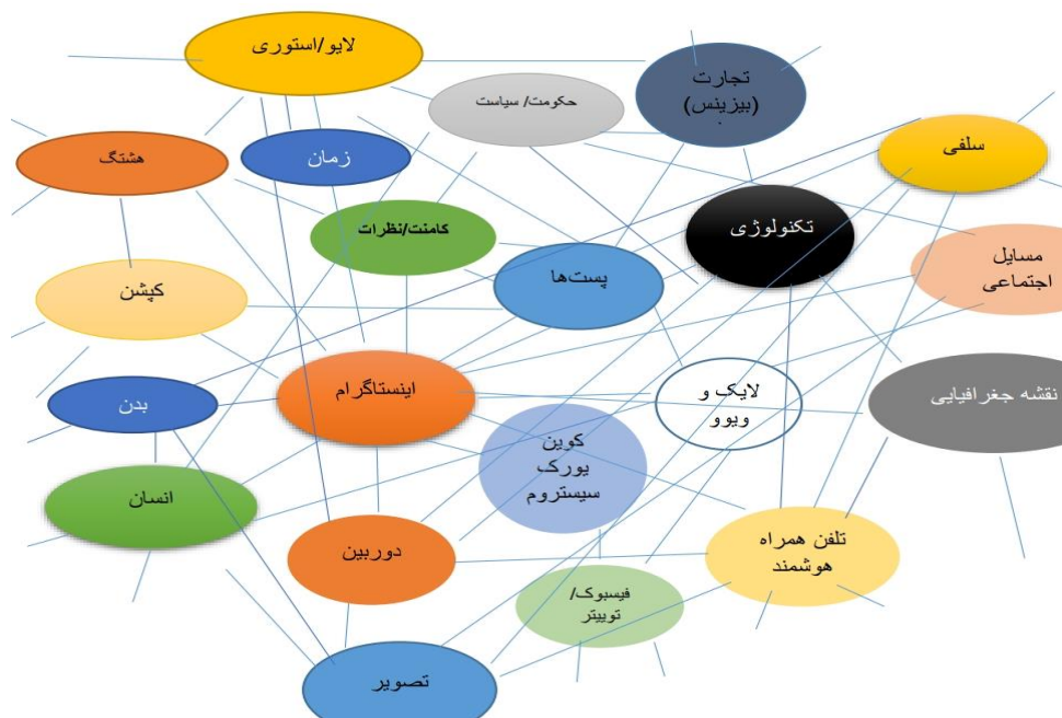
شکل ۱. شبکه اجتماعی-فنی اینستاگرام در اینستاگرامی بیش از انسان