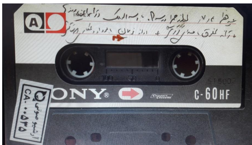
شکل ۲. نمونه‌ای از نوشتن با خودکار درباره محتوای نوار کاست روی برچسب آن