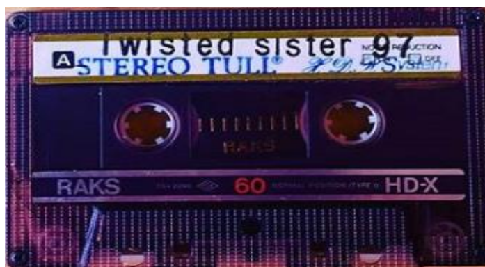
شکل ۱. تصویری از جلد نوار کاست و خود آن تهیه‌شده توسط استریو زیرزمینی تال که در دهه شصت جزو نوارهای کاست غیرمجاز دسته‌بندی می‌شد