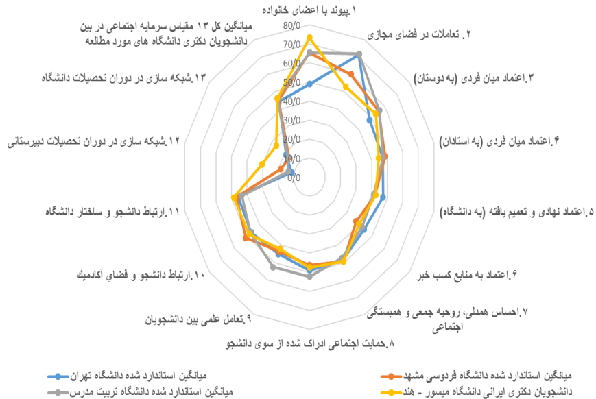
شکل ۲. مقایسه میانگین استاندارد شده مقیاس‌های سیزده‌گانه به تفکیک دانشجویان دکتری در دانشگاه‌های مورد مطالعه

بر اساس شکل ۲، دانشجویان ایرانی مقیم دانشگاه میسور در ارتباط با شاخص‌های سرمایه اجتماعی از دو دانشگاه تهران و فردوسی مشهد در سطح بهتری قرار دارند؛ به طوری که دانشجویان دکتری در حال تحصیل در خارج از کشور در دو شاخص ارتباط با خانواده و شبکه‌سازی در دوره تحصیلات دبیرستانی از میانگین سه دانشگاه ایرانی و همچنین نمونه ملی وضعیت بهتری دارند. هرچند میزان شاخص‌ها بیانگر این است که هر دو گروه دانشجویان ایرانی در حال تحصیل در داخل و خارج از کشور، سرمایه اجتماعی در حد متوسط به پایینی دارند و از این حیث وضعیت آن‌ها تا حدودی مشابه است. با وجود این، دانشجویان دکتری در برخی مؤلفه‌ها نسبت به دانشجویان همه مقاطع تحصیلی (نمونه ملی از یازده دانشگاه) تا حدی وضعیت بهتری دارند.