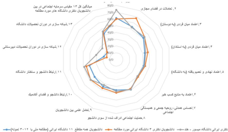
شکل ۳. مقایسه میانگین استاندارد شده مقیاس‌های سیزده‌گانه به تفکیک دانشجویان دکتری ایرانی در حال تحصیل در دانشگاه میسور هند و دانشجویان دکتری سه دانشگاه ایرانی و دانشجویان همه مقاطع تحصیلی یازده دانشگاه (نمونه ملی)