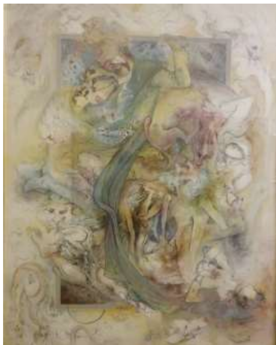
شکل ۵. در سیطره قدرت، ۱۳۵۶، موزه استاد فرشچیان

فرشچیان در همان سال نگاره‌ای با عنوان «در سیطره قدرت» (شکل ۵) با موضوع اجتماعی، انتقادی و اخلاقی دارد که یک حاکم ظالم را به همراه فرد دیگری که زن و همدست اوست (ظاهراً خواهر یا همسر) به تصویر کشیده است. اشخاص درون تصویر چنان مست قدرت‌اند که دچار کوری شده‌اند و ضمن آشامیدن خون موجودات مظلوم، همه چیز را زیر دست و پای خود قربانی کرده‌اند. این نگاره بازنمایی انتقادی شرایط اجتماعی و سیاسی حاکم و گویای احوال، مواضع و گرایش‌های درونی هنرمند است.