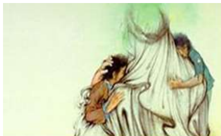
شکل ۴. بخشی از تصویر نگاره پناه