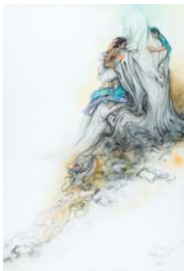
شکل ۲. پناه، ۱۳۵۶، مجموعه آستان قدس رضوی

خانواده که زیبایی‌شناسی خاصی را برای او بسترسازی کرده‌اند، خشوع و اخلاص اخلاقی و اعتقاد او به مظلومیت و تنهایی حضرت امیر در متن سوگواری به تمهیدات و ترکیبی خاص از عناصر انجامیده است. هنرمند با استفاده از فضای خالی، مادیت و محدودیت در زمان و مکان را کنار گذاشته و به مدد خطوط منحنی و غیرفیگوراتیو و مکان‌یابی در بالای تصویر، ضمن نفی جسمانیت از پیکره امام، بر قداست او تأکید ورزیده است. پرهیز از چهره‌پردازی و تلون نیز با قداست و شأن والای امام همراهی دارند. در مجموع این ساختار بصری تبلوری از خلوص قلبی هنرمند و فضای خانه و مادری است که ادراک هنری هنرمند را به سمت ساختاری محزون هدایت کرده‌اند که خشوع هنرمند و اهل خانه در برابر امام علی (ع) و غربت خود او را نشان می‌دهد. به نظر می‌رسد کنش مذکور بی‌ارتباط با شرایط اجتماعی و شرایط فرهنگی زمانه نبوده و از آن‌ها نیز تأثیر گرفته است.