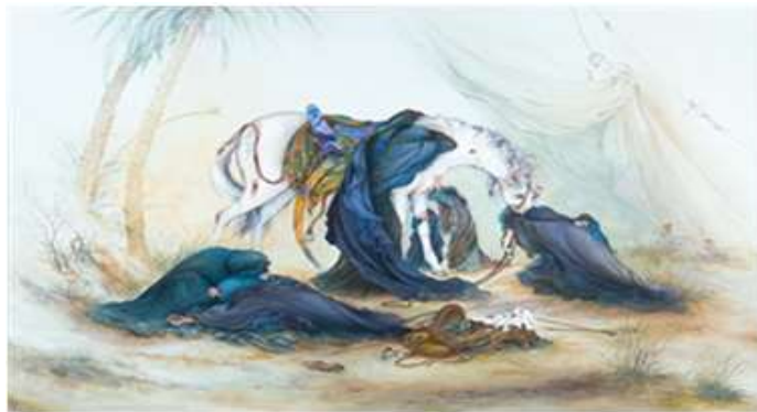
شکل ۶. عصر عاشورا، موزه آستان قدس رضوی، ۱۳۵۵

نگاره پناه در مناسبت شهادت امام اول شیعیان (۲۱ رمضان ۱۳۵۶) که غربت و مظلومیت او زبانزد تاریخ بوده خلق شده است. با توجه به زمینه شخصیتی و فرهنگی هنرمند، چرایی خلق این اثر به‌عنوان کنشی مذهبی در سوگواری امام اول شیعیان از یک سو و فرهنگ بنیادی جامعه که به ارزش‌های شیعی و سوگواری گرایش دارد از سوی دیگر توضیح داده شد. همچنین اینکه چرا موضوع اثر «یتیم‌نوازی» قرار داده شده، با ارجاع به خلوص قلبی و روحیه عاطفی هنرمند و فرهنگ سوگواری شیعیان برای امام علی (ع) و روضه‌های شب شهادت حضرت توجیه شد. با این حال، مضمون اثر لایه‌های معنایی دیگری مرتبط با زمینه اجتماعی و شرایط سیاسی و فرهنگی را دربرمی‌گیرد.