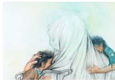
شکل ۳. بخشی از تصویر نگاره پناه

مجموعه آستان قدس رضوی، مجموعه آثار هنرمند